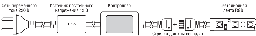
Рис. 2. Подключение.