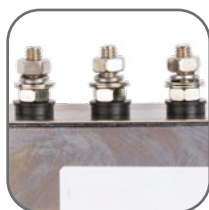
Высокое сопротивление изоляции