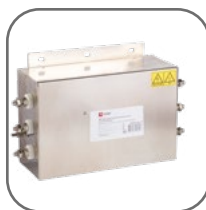
Устойчивость к всплескам напряжения до 1500 В