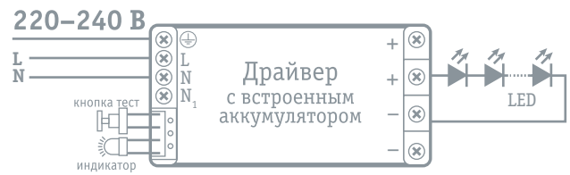
Схема подключения универсального БАП