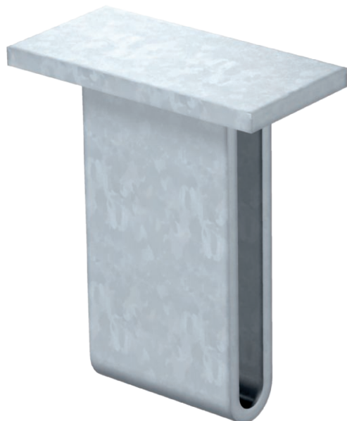
Траверса для стойки US 7