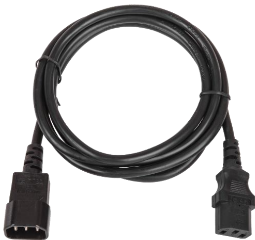
Кабель электропитания TLK-PCM10