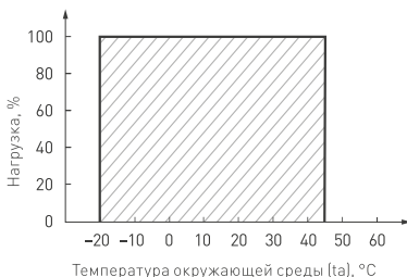
Рис. 3. Максимальная допустимая нагрузка, % от мощности источника