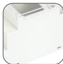
Литая передняя панель