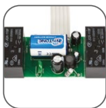
Два встроенных реле на токи до 8 А

Реле времени многофункциональное TM-24 EKF PROxima представляет собой реле с двумя независимыми группами контактов, момент срабатывания которых (включение/отключение) происходит по заданному времени t_1 и t_2 и выбранной функции (24 функции). Возможна коммутация алюминиевым и медным проводом.