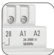
Универсальное питание A1 и A2